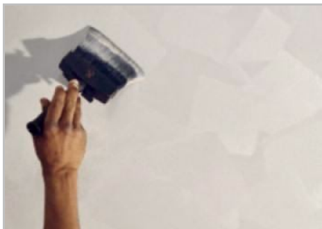
Paso 5 - Segunda mano